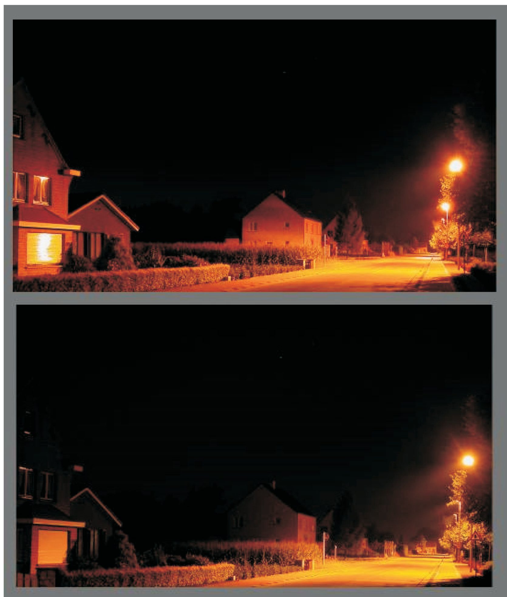
Voor en Na een aantal aanpassingen. De weg is beter verlicht, de huizen worden minder aangestraald.